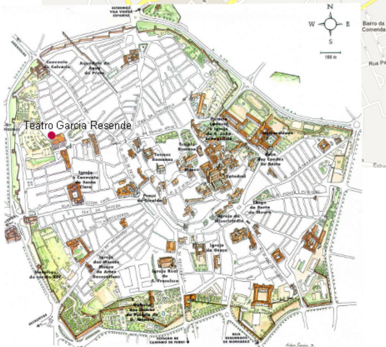
Carte de la ville