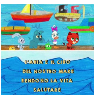
IL CARTONE ANIMATO